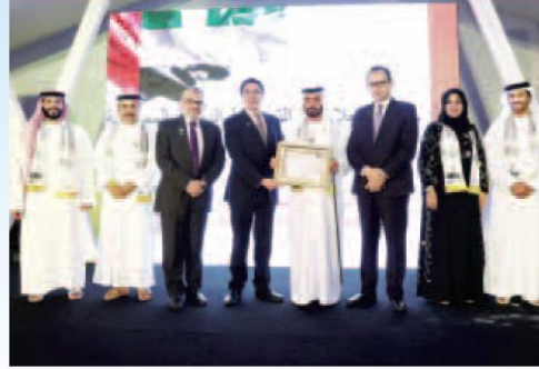
محمد بن خليفة آل مكتوم يتسلم الجائزة

حصلت الدائرة على هذه الجائزة العالمية المرموقة عن فئة الشركات/ المؤسسات البارزة في القطاع الحكومي، وذلك تقديرا من الجهات المانحة للدور الذي تلعبه الدائرة في مجالات التسجيل والتنظيم وتشجيع الاستثمار العقاري ونشر المعرفة العقارية، والكثير من المبادرات التي طرحتها لخدمات القطاع العقاري المزدهر في الإمارة، بما في ذلك سوق دبي العقاري الإلكتروني «إيمارت»، وغيره من الخدمات المتطورة التي أسهمت مجتمعاً في الارتقاء بأفق القطاع العقاري محلياً وعالمياً. وقال سلطان بطي بن مجرن، مدير عام دائرة الأراضي والأملاك في دبي: «إننا نعرب عن بالغ فخرنا للحصول على هذه الجائزة العالمية المرموقة، خاصة وأنها تمثل تقديراً عالمياً للجهود التي نبذلها لخدمات سوق العقارات محلياً، إضافة إلى أنها تضع نماذج ومعايير يمكن للمؤسسات الأخرى حول العالم الاقتداء بها لتحقيق التميز في هذا المجال». وأضاف ابن مجرن: «بهذه الطريقة، يمكننا الإسهام في تقدم ورخاء شعوب العالم عن طريق توفير الخدمات المبتكرة التي توفر الجهد والوقت والمال للجميع، والانتقال إلى الحلول الذكية والمبادرات الخلاقة للتخلص من الرتابة والروتين في كافة الإجراءات الحكومية. ويشهد على ذلك عدد الوفود الإقليمية والعالمية التي نستقبلها من شتى أنحاء العالم للاطلاع على